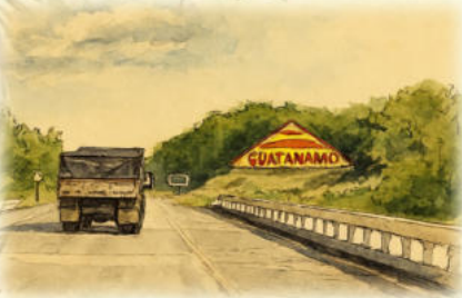
PASSSTRASSE „LA FAROLA“